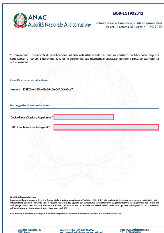
Figura 1 - Esempio di modulo PDF per la dichiarazione di adempimento

E' mostrata di seguito un'immagine con il modulo PDF da utilizzare per la comunicazione: